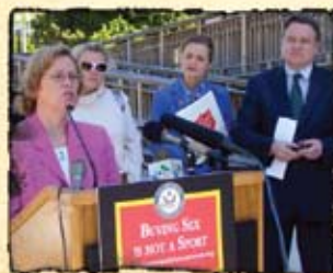
Belangenbehartigers in Washington DC vragen aandacht voor vrouwenhandel tijdens de 2006 Wereldbeker wedstrijden in Duitsland.

De Nationaal Rapporteur Mensenhandel (NRM) signaleerde een stijging van het aantal gesignaleerde slachtoffers van mensenhandel in Nederland. In 2006 waren er volgens de NRM 579 slachtoffers, deze trend heeft zich voortgezet in 2007 (716) en in 2008 (826) (BNRM, 2008; TIP Report, 2009). Het OM behandelde 216 trafficking zaken in 2006, en de rechter behandelde 100 zaken. Dit heeft geresulteerd in 90 veroordelingen, waarvan 70 voor trafficking (BNRM, 2008). In 2007 werden er 221 zaken behandeld, waarvan in 120 zaken de rechter een uitspraak heeft gedaan. In 81% van de gevallen kwam het tot een veroordeling (TIP Report, 2009).