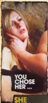
Leger des Heils anti Sex-Trafficking flyer tijdens het WK 2006 in Duitsland.