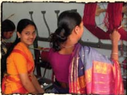
Een Leger des Heils project in Bangladesh emancipeert vrouwen in het arbeidsproces voor preventie van trafficking, en voor reïntegratie van slachtoffers.